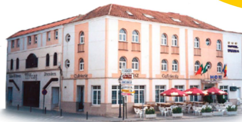
Hotel Diana (Plaza Juan Carlos I, n 1).